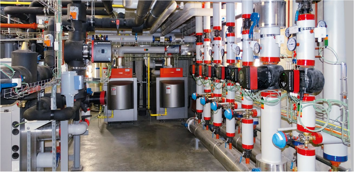
Die HKL-Regelung des Universitätsgebäudes umfasst mehr als 4.000 I/O-Punkte.